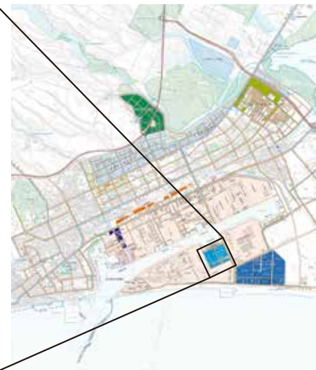
苫小牧における立地 Location in Tomakomai