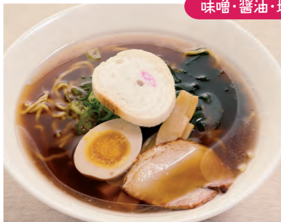
ラーメン各種 850円 (税込)